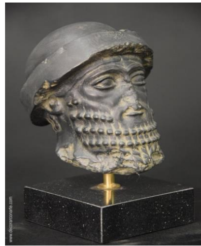
Hammurabi, roi de Mésopotamie (Irak de nos jours)

C'est un daguerréotype, du nom de son inventeur, Louis Daguerre. Le sujet doit rester immobile une quinzaine de minutes pour fixer l'image, ce qui n'est pas pratique.