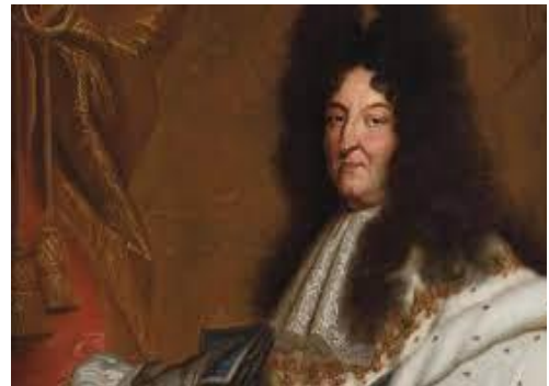
Portrait de Louis XIV