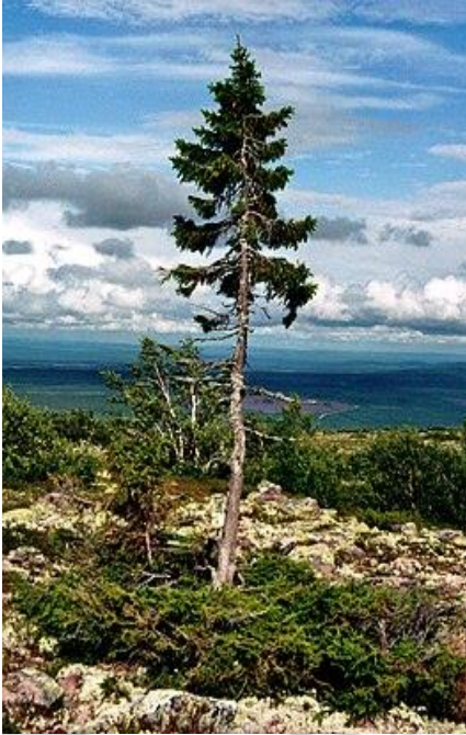
Tjikko le Vieux

Il y a un arbre en Norvège qui a 6500 ans. On l'appelle Tjikko le Vieux.